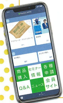
8月導入予定のLINEオフィシャルアカウント操作画面