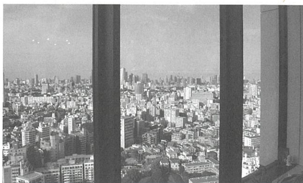
周囲に視界を遮る建物はなく、東京タワーも一望できる

講義はオンラインで行う。初級コースは90分の講義を4回、今秋スタート予定の上級コースは90分の講義を12回実施。腸内環境に関する追加プログラムなどの「補講」の際には、中目黒のサロンも活用するという。アカデミーで使用する全160ページの教科書は、1年間かけて制作した。