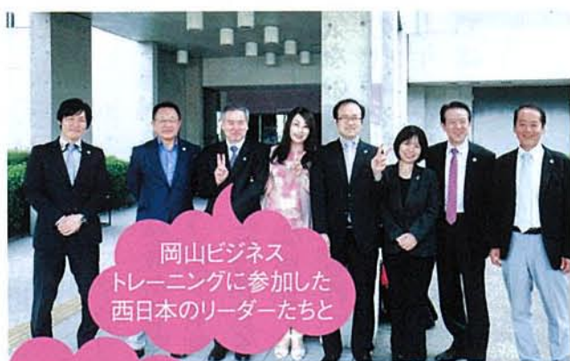
岡山ビジネストレーニングに参加した西日本のリーダーたちと